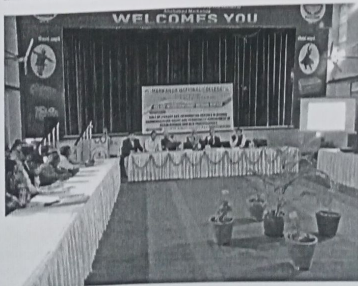
DHE.APPROVED NATIONAL SEMINAR (15-11-2019)